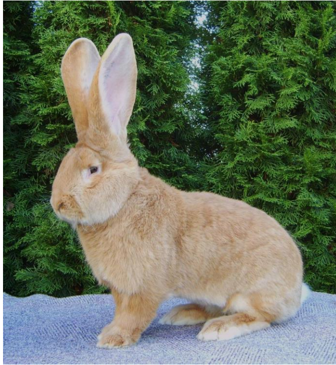
Beliebteste Kaninchenrasse des Jahres 2021: Deutsche Riesen gelb